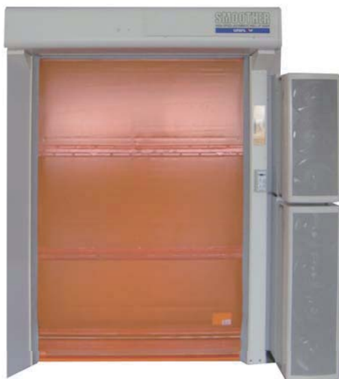
※写真は防虫システムです。

開口部の全面に強力な噴流で風のカーテンをつくり、空気中の虫やホコリの侵入をシャットアウトします。 エアーカーテンで空気の流出量削減にもなり、省エネにつながります。