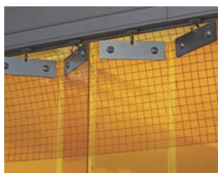
レール下部隙間用シート (防虫タイプ0.55t糸入り)