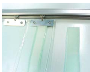
マジックテープ(50巾)加工 片引き用 (受けは両面テープ付きになります)