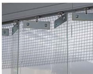
レール下部隙間用シート (防災静電タイプ0.5t糸入り)