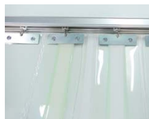
マジックテープ(50巾)加工 引分け用