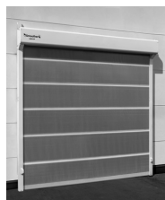
RX, RBシリーズ *画像はRXシリーズ

【品番について】制御盤ボックス内のシールで確認できます。 （一部制御盤ボックスがない機種もあります）